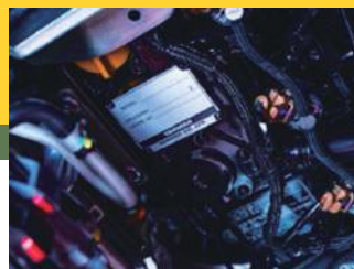
CONCEPT DE MOTEUR YANMAR