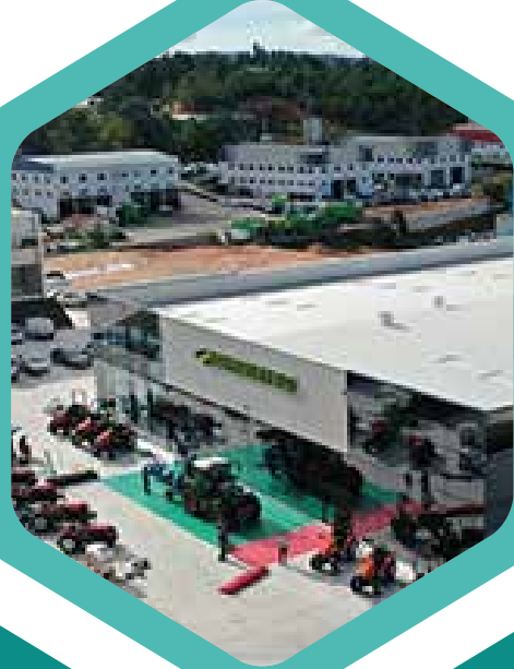
Loja Vinomatos ( Zona Industrial Ourém )

Loja Agrícola / Materiais Agrícolas / Manutenção