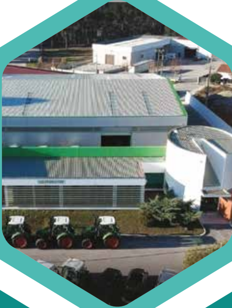
Sede de Empresa: ( Ourém | Portugal )

A Vinomatos , é assim uma marca diferenciadora, com a capacidade de adaptação em termos técnicos e logísticos sustentam a nossa presença mundial e permitem a valorização de novas soluções e procura de novos mercados de trabalho, evoluindo todo o seu know-how pelas constantes necessidades de expansão internacionais em toda a sua estrutura corporativa, ao serviço de todos os nossos clientes.