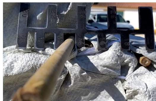
Medição do tutor de bambu da Vinomatos

Quando falamos no diâmetro do tutor de bambu, falamos precisamente da largura total da cana de bambu, na sua base, onde o corte é realizado. Ou seja, quando dizemos que um tutor de bambu tem 0,90 m de altura e diâmetro de 10/12, estamos a querer dizer que na base da cana de bambu, (onde o bambu é enterrado e precisa de maior resistência) o corte poderá variar entre 10 a 12 milímetros, sendo que este diâmetro varia ao longo do comprimento da cana.