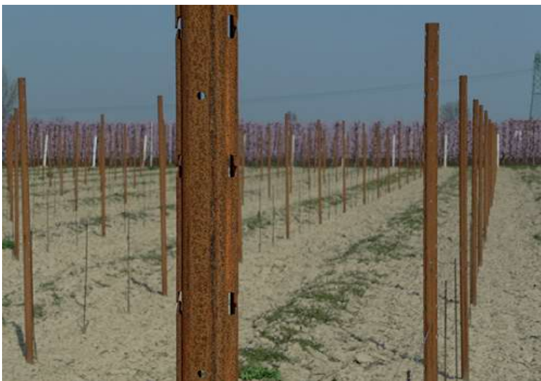
Piquets Intermédiaires de Vigne Cor – Ten Renforcé